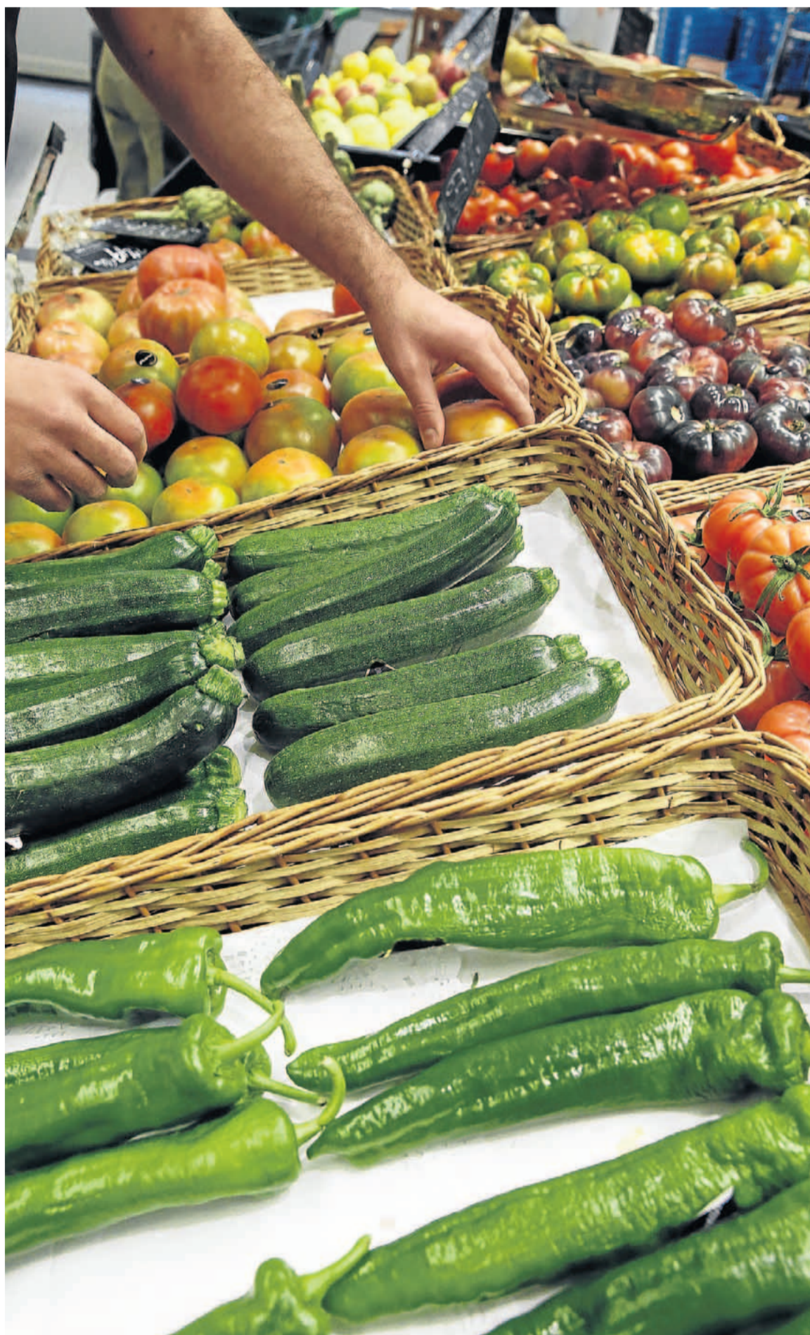
Mostrador de hortalizas en un comercio vallisoletano.

► Pimiento. Se encareció el 39,6% durante los primeros días de enero y el 18,43% más la semana pasada.