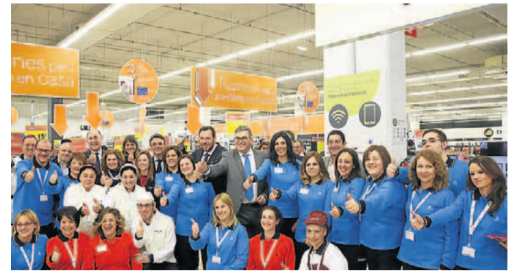
Puente, García Aparicio y representantes de instituciones y empresas vallisoletanas posan con un grupo de trabajadores. G. v.

VALLADOLID. El calendario comercial para 2017 permitirá la apertura de 16 festivos en Zaratán y Arroyo, pero solo de 15 en la capital. ¿Por qué? La normativa autonómica fija, con carácter general, 10 festivos de apertura. Además, la Junta autoriza otros seis más a Arroyo, Zaratán y la capital, al entender que estos municipios son focos de interés turístico comercial. ¿Qué ha pasado? Pues que en ambos listados (el general y el particular) figuraba el 30 de abril. La Junta ha pedido a los ayuntamientos de estas localidades cambiar esa fecha añadida. Arroyo y Zaratán se quedan con el 3 de diciembre. El Ayuntamiento de Valladolid (que propuso limitar los festivos a 12) ha decidido no ofrecer alternativa, con lo que se quedará con 15 fechas. El 3 de diciembre abrirán, por ejemplo, Río Shopping y Equinoccio, pero no Vallsur o El Corte Inglés. Avadeco pide la creación de una mesa (con las partes implicadas) que analice los beneficios reales, en aumento de ventas y empleo, de esa apertura de 16 festivos que califica excesiva.